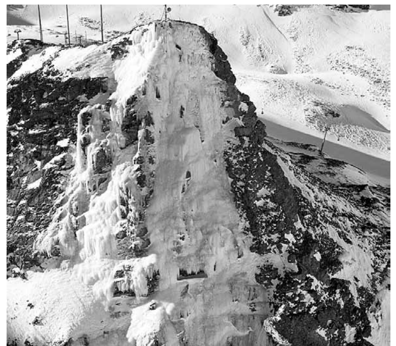
Der vereiste Corn da Diavolezza.

Die Workshops am Sonntag, 28. März, sind offen für alle, die zum ersten Mal Eisklettern ausprobieren möchten oder sich neue Tricks von einigen der weltbesten Eiskletter-Athleten anschauen wollen. Die Top-Cracks Ines Papert, Albert Leichtfried, Markus Bendler sowie Jack und Petra Müller zeigen in kleinen Gruppen ihre Tipps und Tricks in abgesicherter Umgebung mit Bergführern. Eiskletter-Ausrüstung steht den ganzen Tag zum Ausleihen und Testen zur Verfügung. Bei schlechtem Wetter finden Wettkampf und Workshops an der neuen Drytooling-Anlage beim Sportpavillon in Pontresina statt. Am Samstagabend nach dem Wettkampf steigt eine Eisparty im Sportpavillon mit Pastaplausch, Filmen, Livemusik und Drytooling-Show. Weitere Informationen zum Programm sowie Anmeldungen für die Workshops und den Wettkampf gibt es unter www.Ready2Climb.com